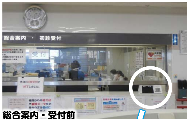
総合案内・受付前