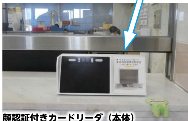
顔認証付きカードリーダー（本体）